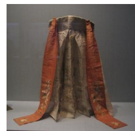
고대, 허리부터 아래에 두른 의상