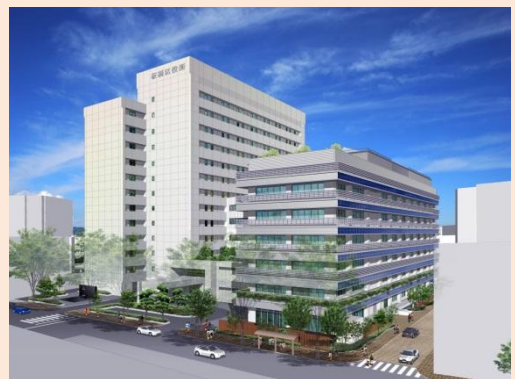
(본청 남관 완성이메지: 우측 7층건물)

또한, 어린이들의 학력향상과 교육지원기능을 충실시키기 위해, 「교육지원센터」를 남관에 설치했습니다.