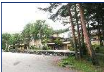
【소년 자연의 집 야츠키타케장】