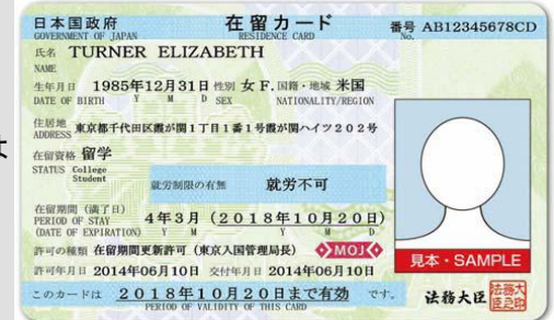
ざいりゅう みほん (在留カード・見本)

くわしくは、下記の外国人在留総合インフォメーションセンター にお問い合わせいただくか、法務省入国管理局ホームページをご覧ください。