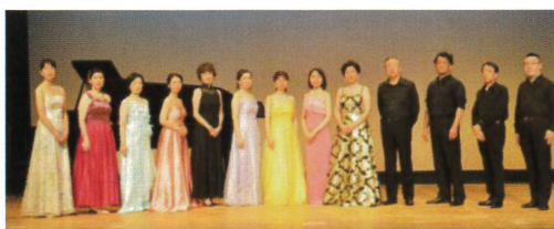
フレスカリア合唱団